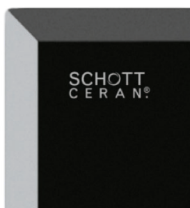
Płyta vitroceramiczna SCHOTT CERAN