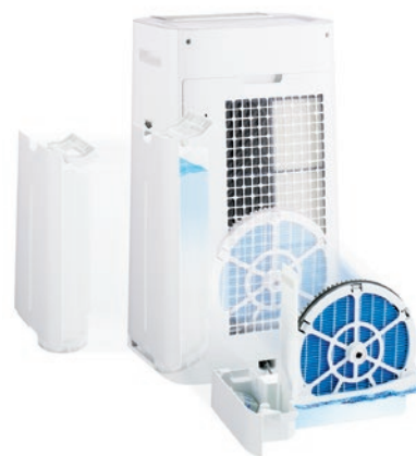
Obrotowa struktura mechanizmu nawilżającego